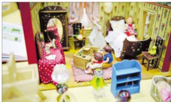
Svebølle Samlerklub inviterer til Vestsjællands største samlermesse søndag den 5. marts.