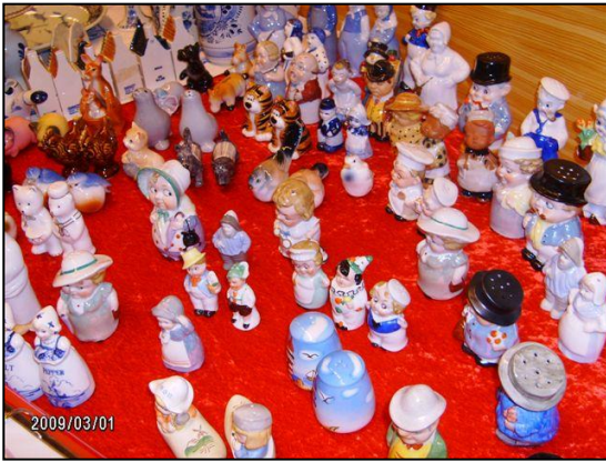
Salt- og pebersæt