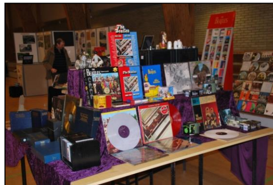
The Beatles-plader o.a. Beatles-effekter

Flødekøer, babushkadukker, postkort med a) fyrtårne, b) ældre med nisse og kat.